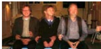
Trilbank tijdens mixage

In opdracht van de Stuurgroep Floriade van de Nederlandse Waterbeheerders plus het Waterschap Haarlemmermeer en het Hoogheemraadschap Rijnland produceerde Carillon een audiovisuele tijdreis inclusief sprekende robot. De spannende tijdreis wordt gemaakt door de geschiedenis van de Nederlandse waterschappen. Daarbij zijn de nieuwste audiovisuele beeld-, montage- en mediatechnieken toegepast. Behalve het standaard subwooferkanaal in een 5.1 surroundmix, is aan deze show ook nog een extra audiokanaal toegevoegd. Hiermee konden wij de speciale tril-apparaatjes die in de banken van de toeschouwers zijn geplaatst, besturen en activeren, waardoor op een paar momenten in het programma een bijzonder sensatiegevoel aan de "onderkant" kon worden opgewekt. Bob Kommer Soundstudio's tekende voor de Foley opnamen en de 6.1 surround geluidsmixage.